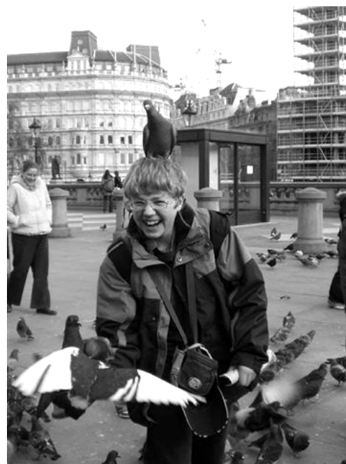
Лондон. Трафалгарская площадь.