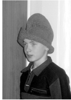
Испанский шлем (экзамен по вязанию)

Урок, традиции и обычаи вел у нас профессор Дамблдор. Правда, говорили мы по-английски; но это нас не смутило, потому что мы уже привыкли. На уроке. Было очень интересно. Профессор Дамблдор, взял из магического ящика, ту информацию, которая нам нужна. Особенно мне интересно мне было читать про создателей школы