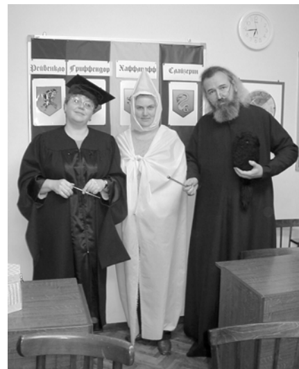
Профессорский состав школы Хогвартс

Игра всем понравилась, ее продолжение ждут с нетерпением.