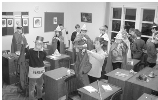
Мы становимся волшебниками

Журналисты: Алексей Нечмир, Георгий Путра, Акинтьев Евгений, Мецзяков Вадим, Дмитрий Румянцев