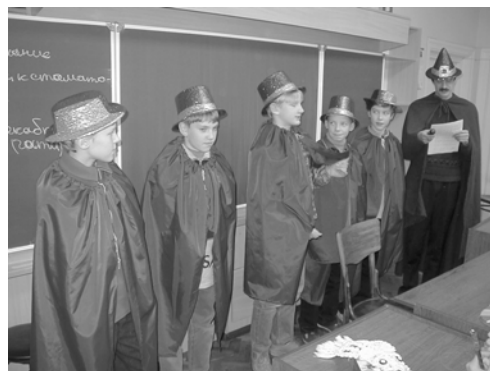
Вступительные экзамены по истории Хогвартса