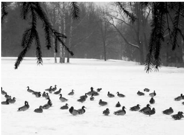
Мы увидели множество уток