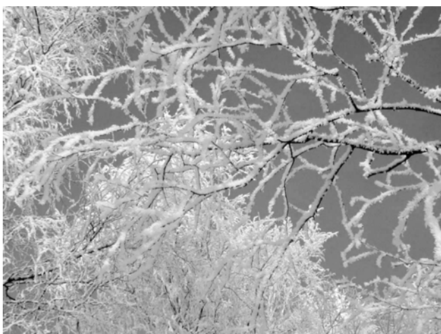
Чудесный иней 22 января 2001 г.