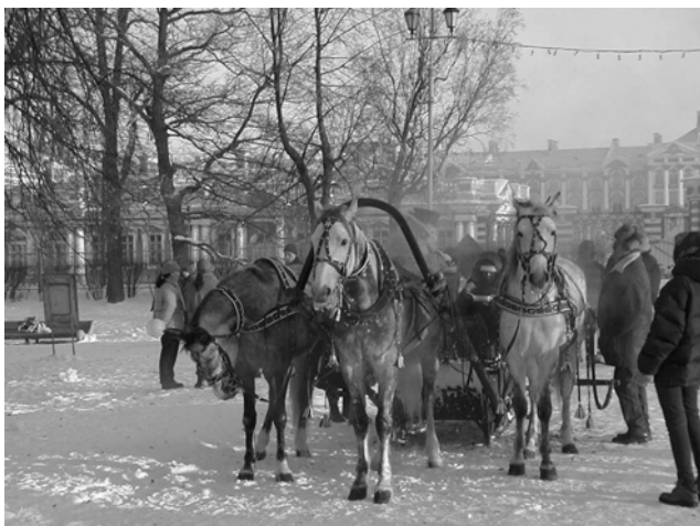
Тройка в Александровском парке